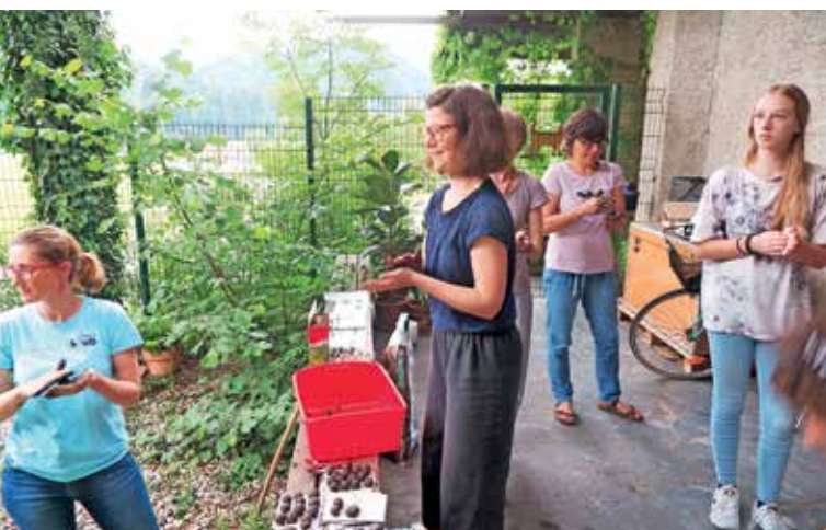
Izdelovanje semenskih bomb v Mačjem dolu