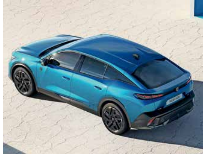
Peugeot 408, edinstven v družini Peugeot, v dolžino meri 4,69 metra, širok je 1,86 metra in visok 1,48 metra.

Peugeot 408 bodo v Evropi poganjali trije motorji. Vstopni bo bencinski trivaljnik s 96 kW (130 KM), večina prodaje pa bo osredinjena na hibridna modela s 132 kW (180 KM) in 165 kW (225 KM). Kasneje bo sledila še povsem električna različica. Pričakujemo, da bo avto cenovno med modeloma 308 in 508, izdelovati pa naj bi ga Francozi začeli konec letošnjega leta.