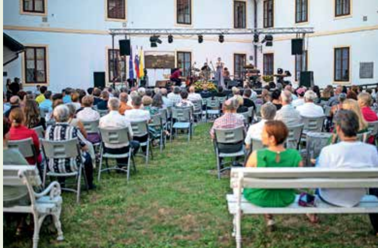
Slavnostna akademija ob občinskem prazniku je na dvorišče Loškega gradu privabila številne goste.

Za kakovostno in vsestransko delovanje združenja in ohranjanje vrednot NOB ter dolgoletno organizacijsko odličnost je srebrni grb prejelo Združenje borcev za vrednote NOB Škofja Loka. Združenje borcev za vrednote NOB Škofja Loka je samostojna, domoljubna, prostovoljna in nepridobitna organizacija civilne družbe, v katero se z namenom uresničevanja skupnih interesov združujejo borci, drugi udeleženci narodnoosvobodilnega in protifašističnega boja ter druge osebe, ki imajo pozitiven