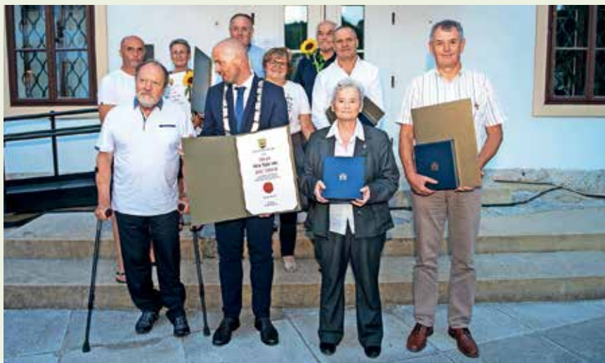
Občinski nagrajenci za leto 2022

Kljub zelo uspešni mednarodni karieri Jan ni pozabil svojega prve-