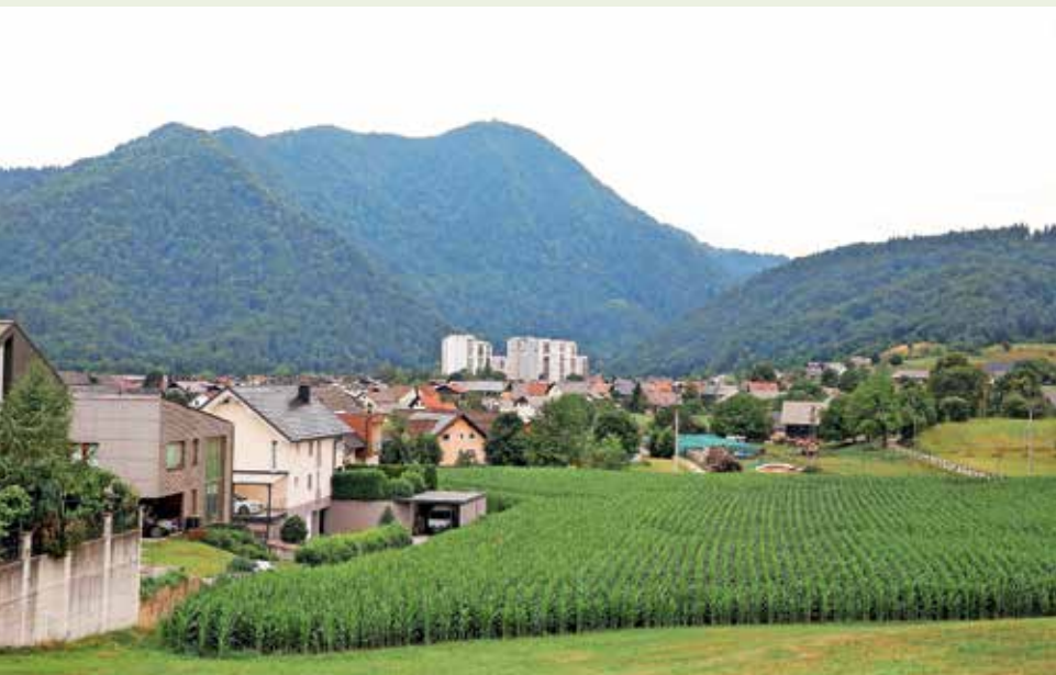
Znak je v Sloveniji sprejet kot standard, ki potrjuje, da je turistična ponudba trajnostno naravnana.

pred ostalimi destinacijami v Sloveniji in širše. Danes se s tem znakom ponaša že 58 destinacij, 101 ponudnik nastanitve, štiri naravni parki, osem turističnih agencij, šest turističnih znamenitosti, 40 restavracij in ena plaža. Znak je v Sloveniji sprejet kot standard, ki potrjuje, da je turistična ponudba trajnostno naravnana. To pa tudi pomeni, da je turistični sektor to prepoznal kot vse bolj pomemben kriterij pri izbiri počitniške destinacije vedno večjega števila ozaveščenih turistov. Ohranjanje in nadgradnja trajnostne naravnosti destinacije zato predstavlja naložbo ne samo v večjo prepoznavnost Škofje Loke med obiskovalci, temveč tudi večje zadovoljstvo občanov, so še zapisali v gradivu.