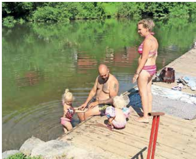
Tudi simpatična družina iz Nizozemske je bila navdušena nad ohladitvijo na puštalskem kopališču.

Se je pa seveda moč osvežiti v Poljanski Sori. Na priljubljenem kopališču v Puštalu je te dni zalo živahno, ohladitve v prijetno topli vodi pa ne izkoriščajo le domačini, pač pa tudi turisti, ki se ustavijo v Škofji Loki. »Na poti proti morju, ki je za nas dolga okoli 1100 kilometrov, smo