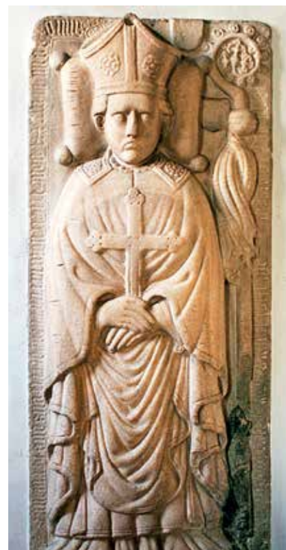
Freisinški škof Herman Celjski na nagrobniku v stolnici sv. Danijela v Celju

knežji status. Ob smrti škofa Konrada V. je dinastiji Celjskih načeloval Herman II. (1385–1435). Leta 1396 se je skupaj s tedanjim ogrskim kraljem in kasnejšim cesarjem Svetega rimskega cesarstva Sigismundom Luksemburškim udeležil križarske vojne proti Turkom. Po neuspehu in porazu krščanske vojske pri Nikopolu v današnji Bolgariji je rešil kralja Sigismunda in mu omogočil umik na varno. S tem dejanjem si je pridobil Sigismundovo naklonjenost, postal njegov tesni svetovalec in v njem našel mogočnega zaveznika, kar je pomembno prispevalo k vzponu celjske dinastije. Herman II. je imel poleg svojih zakonskih otrok še nezakonskega sina Hermana (1383–1421), ki pa ga je kasneje priznal in ga s študijem v Bologni izšolal za duhovnika. Nato je ob pomoči cesarja Sigismunda uredil, da ga je papež Janez XXIII. leta 1412 imenoval za freisinškega škofa. Ker pa je bil Herman tedaj še premlad za posvetitev v škofa, je dobil poseben papeški odpustek, da je lahko vodil freisinško škofijo. Pri očetu si je izposodil 10.000 goldinarjev, da je plačal takso za škofovsko službo papeški kuriji. Izposoja denarja je imela tudi posledice, saj je moral očetu za obdobje štirih let zastaviti loško gospostvo,