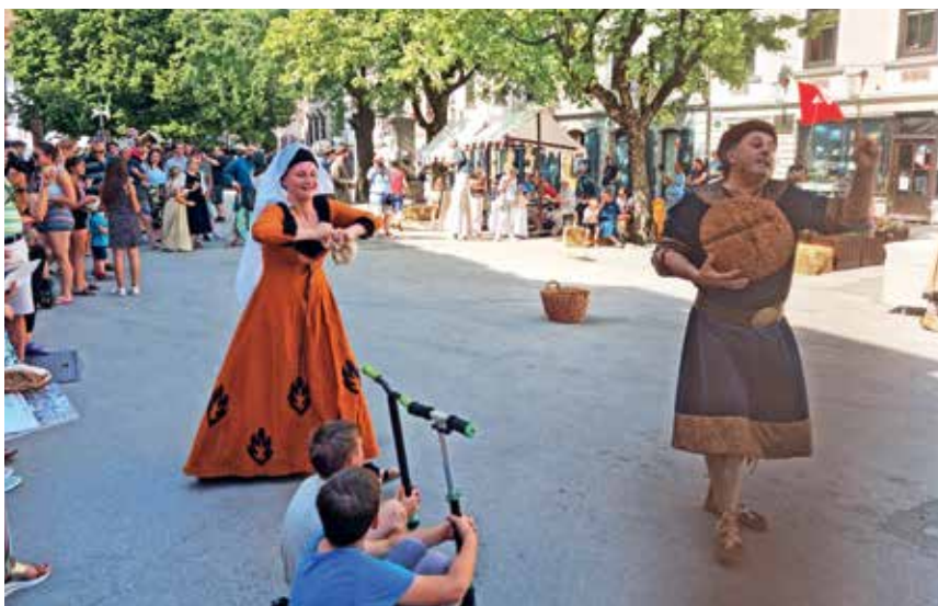
V dramsko igro Kruh in pivo so vključili tudi gledalce, ki so jim delili kruh.