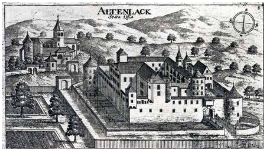
Stara Loka po Valvasorju, 1679. V starološki cerkvi je škof Konrad V. našel svoje zadnje počivališče.

ki je tako začasno prešlo v last grofov Celjskih. Vendar se je vse dobro izteklo in po določenem času je bilo gospostvo vrnjeno freisinški škofiji. Herman se je med letoma 1414 in 1418 aktivno udeleževal cerkvenega zbora v Konstanci ob Bodenskem jezeru, kjer je zastopal predvsem interese cesarja Sigismunda. Leta 1421 ga je papež Martin V. imenoval za tridentinskega škofa. Papež ga je moral na to mesto v istem letu ponovno imenovati, ker ga tridentinski kapitelj ni hotel priznati zaradi njegove telesne hibe – imel je namreč močno izraženo kilo, zato se ga je tudi prijel vzdevek herniosus – kilavi. Da bi škofovsko mesto v Tridentu (današnje mesto Trento v severni Italiji) dobil in ohranil, se je vrnil v Celje na operacijo, ki pa je ni preživel. Umrl je 13. decembra 1421 in bil pokopan v celjski župnijski cerkvi, sedanji stolnici sv. Daniela, kjer se še danes nahaja njegov nagrobnik.