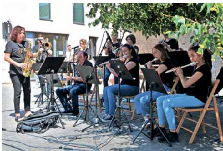
Učenci GŠ Škofja Loka so se znova predstavili v okviru O'glasbene Loke.

zasedel 5. mesto, kar mu je prineslo mesto v slovenski ekipi na evropski računalniški olimpijadi v Varaždinu.