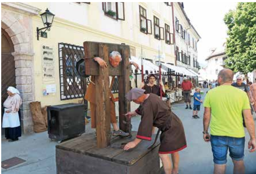
Na loškem »placu« so pričarali živahen utrip preteklih stoletij.

Ponudniki so tako predstavili različne vrste kruha in moke, ogledati si je bilo mogoče prikaz izdelave malega loškega kruhka in postopke varjenja piva, kar so nadgradili z degustacijo lokalnih piv. Dogajanje so popestrili s pouličnimi nastopi plesnih in glasbenih skupin, na manjšem odru na Trgu pod gradom pa je bilo mogoče spremljati tudi nastope škofjeloških osnovnih šol. Otroci so prišli na svoj račun tudi na Trgu pod gradom, kjer so zanje pripravili ustvarjalne delavnice, na Cankarjevem trgu pa so se lahko pridružili etnološko-rokodelskim delavnicam ter uživali ob lutkovnih predstavah, starih igrach in pravljicah. Osrednji dogodek je predstavljala dramska uprizoritev igre Kruh in pivo, ki je potekala po mestnem jedru med gledalci. Pester je bil tudi spremljevalni program. Prostor med ateljejem Amuse in sodobnim tekstilnim centrom Kreativnice je bil namenjen tekstilu in klobučarstvu, v Rokodelskem centru DUO si je bilo mogoče ogledati razstavo histori-