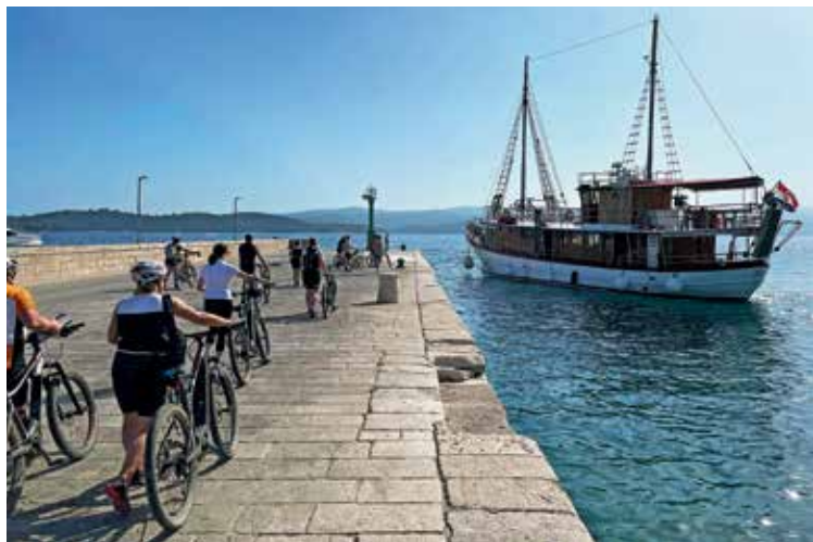
Po koncu vsake etape nas je čakala barka, ki nas je peljala na novo lokacijo.