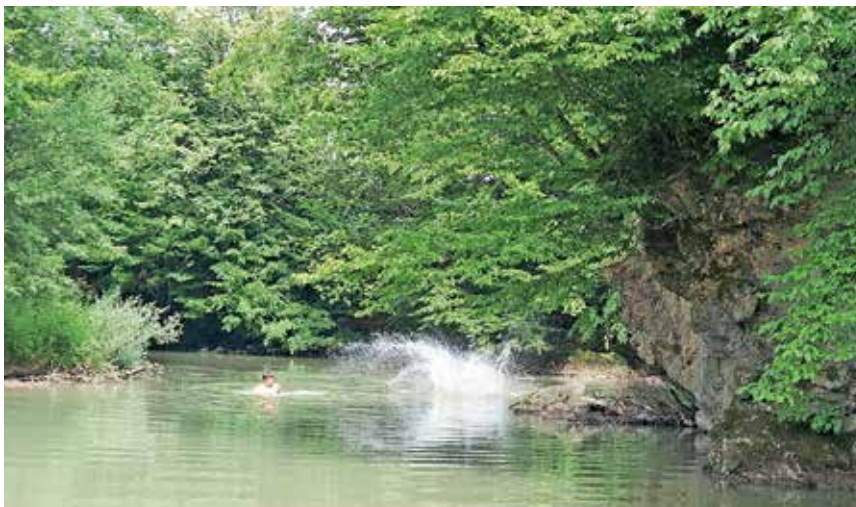
Kopanje v motni Selški Sori letos odsvetujejo.

Tako so na škofjeloški občini že na začetku kopalne sezone naročili strokovno analizo vzorcev površinskih kopalnih voda na lokacijah naravnih kopališč oziroma kopalnih območij, kjer je v poletnem času največ kopalcev.