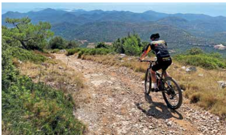
Del trase je bil speljan po makadamskih cestah. Na fotografiji spust s Huma, najvišjega vrha otoka Lastovo.

ska baza in prva obrambna linija. Dolga desetletja po drugi svetovni vojni je bil onemogočen normalen turistični razvoj. Z barko smo se vrnili v Brno na Korčuli, kjer smo naslednje jutro začeli zadnjo, peto etapo Brna–Karbuni–Blato–Prigradica–Vela Luka (59 km, 950 višinskih metrov). Dobra del smo kolesarili po makadamskih poteh ob obali in občudovali krasne zalive, kristalno čisto morje in številne bolj ali manj luksuzne apartmaje. Korčula ima bogato zgodovino. Kolesarjenje po večjih hrvaških otokih smo letos zaključili.