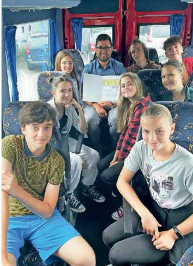
Mlada moč Loškega odra v predstavi Pekarna Mišmaš