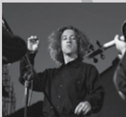
Noč treh kitaristov