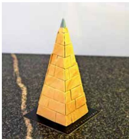
Zmagovalna Plečnikova piramida

Organizatorje natečaja je navdušilo šestnajst prispelih avtorskih receptov za sladico, ki so jih očarali s svojo izvirno kombinacijo okusov in vpletanjem Plečnikovih arhitekturnih