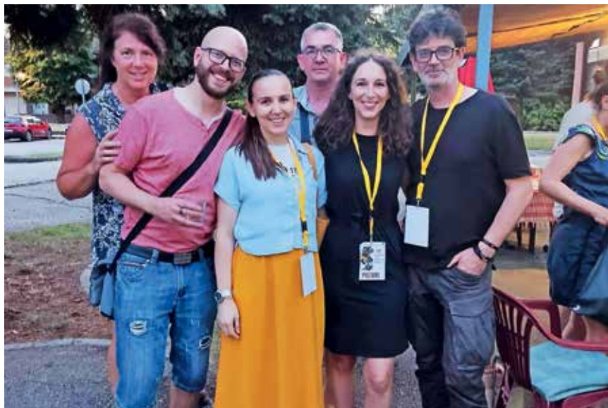
Ponovno odlična ekipa predstave Antigona v New Yorku

Takole sem ob premieri med drugimi zapisal o škofjeloški Antigoni v New Yorku: »V predstavah Loškega odra običajno zaznavam homogeno ansambelsko igro, občutek, da so vsi eno v gradnji in podreditvi skupin-