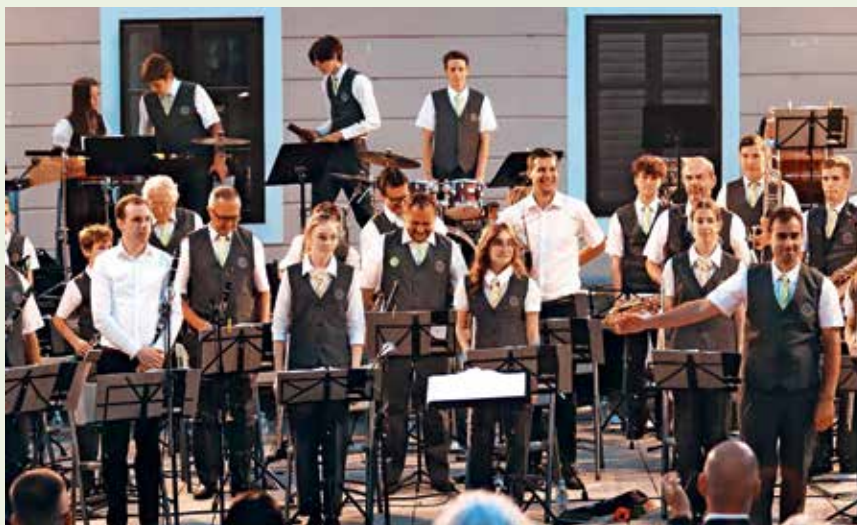
Za kulturni program s prepletom zimzelenih slovenskih uspešnic je poskrbel Mestni pihalni orkester Škofja Loka.

nas pripravljene sprejemne centre v tujini, ampak smo ostali doma, trdno odločeni, da ubranimo svoje hiše, s krediti kupljena stanovanja, že pred službo zorana polja, nedokončane raziskave. Saj to je bila in je naša domovina, za katero smo si želeli tudi svojo neodvisno državo.«