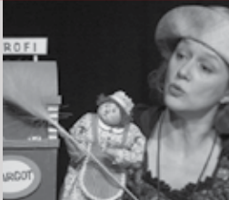
Ves svet je marmelada