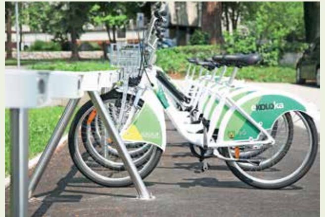
Mrežo izposoje koles želijo še širiti.

Že po prvem mesecu vzpostavitve so uporabniki zelo zadovoljni. »Prvi odzivi so super. Občani kličejo, pišejo, pozdravljajo projekt in si želijo še dodatnih postaj. Seveda